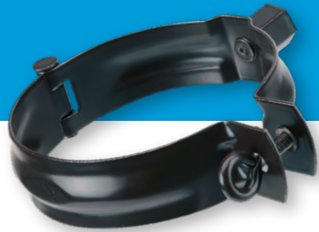
Ablaufrohrschelle mit Gewindemuffe , feuerverzinkt und pulverbeschichtet

Unsere Rohrschellen sind passend für zahlreiche Dachentwässerungssysteme und Montagearten erhältlich. Präzise produziert und einfach montiert.