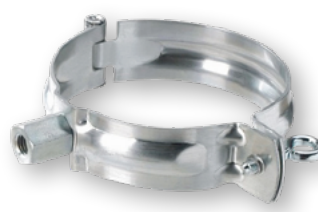
Ablaufrohrschelle mit Gewindemuffe , Zink