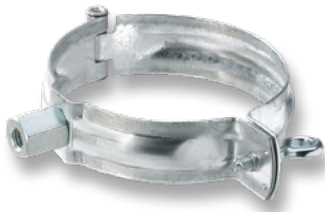
Ablaufrohrschelle mit Gewindemuffe , feuerverzinkt