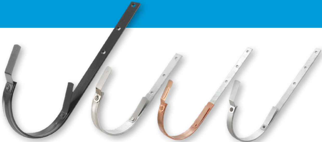
Rinnenhaken, feuerverzinkt und pulverbeschichtet

Unsere Rinnenhaken sind in verschiedenen Materialausführungen erhältlich.