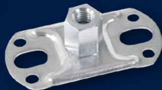
Montageplatten für Ablaufrohrschellen mit Gewindestift