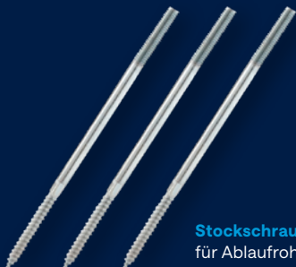
Stockschrauben für Ablaufrohrschellen mit Gewindemuffe